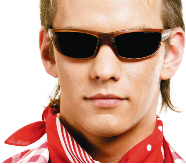
Brille: Porsche Design

Ein gutes Sonnenbrillenglas – ob mit Korrektur oder ohne – erkennt man mit einem einfachen Test: Halten Sie die Brille etwa 30 bis 50 Zentimeter vor eine gerade Linie oder Kante. Das Glas darf diese Gerade nicht „knicken“ oder biegen. Wenn doch: Finger weg! Das gilt auch, wenn das Glas Schlieren oder Einschlüsse hat. Derart minderwertige Gläser wollen Sie Ihren Augen nicht zumuten. Ob dagegen die Gläser aus Kunststoff oder Mineralglas sind, bleibt Ihrem Geschmack überlassen. Glas ist etwas unempfindlicher, Kunststoff ist leichter. Fragen Sie Ihren Augenoptiker nach seinen Empfehlungen.