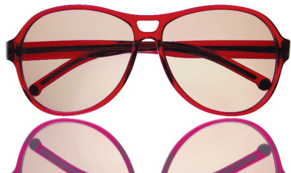
Brille: Marc O' Polo Campus

Diese Broschüre wurde Ihnen überreicht von: